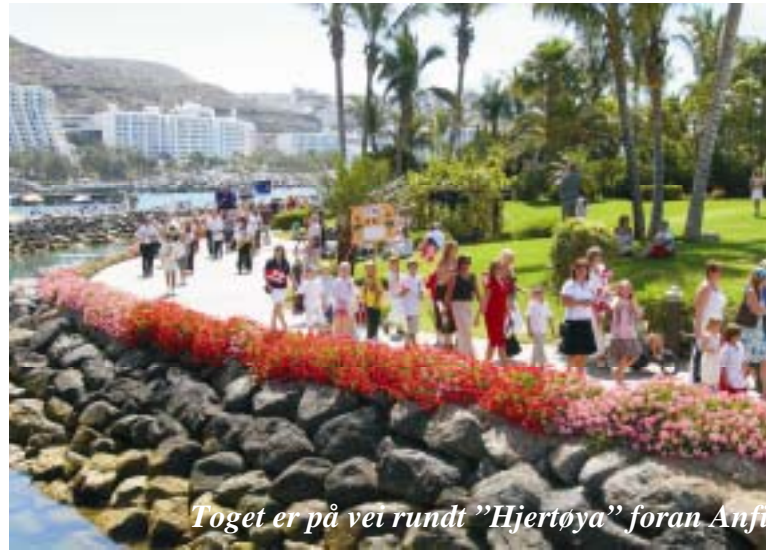
Toget er på vei rundt "Hjertøya" foran Anft