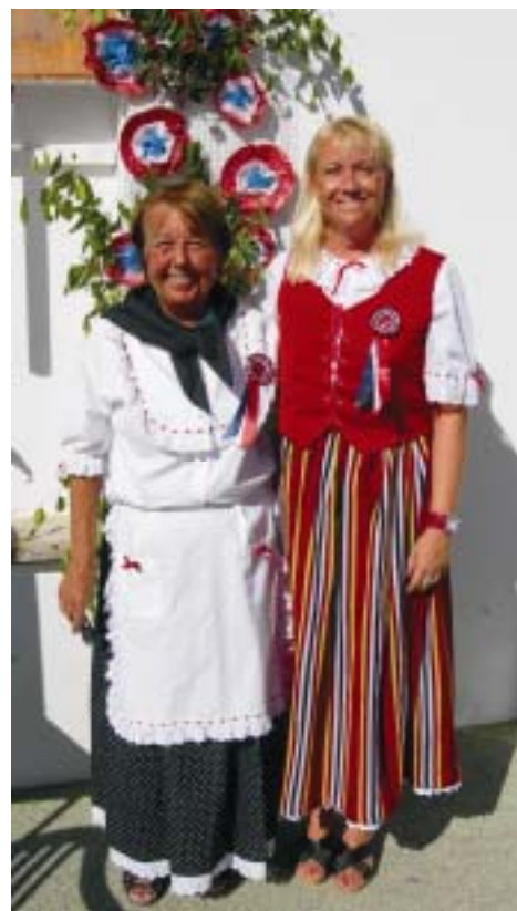
Mor og datter i kanariske festdrakter fra Tejeda og Mogan.