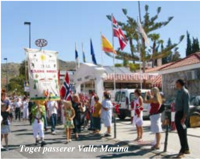
Toget passerer Valle Marina