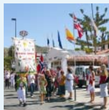
17. MAI s.10-11