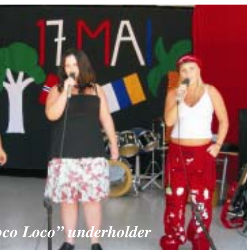
„Loco Loco” underholder