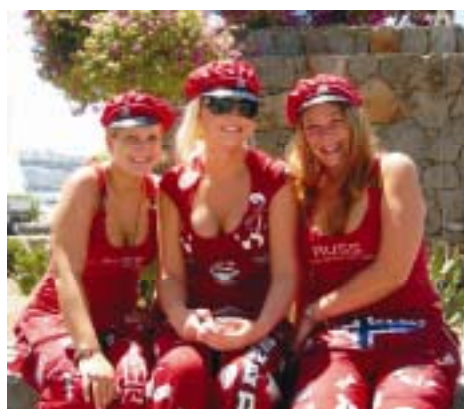
Tre unge nyutsprungne russ i mer enn tye grader pluss...