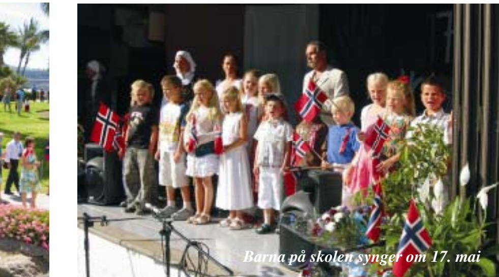
Barna på skolen synger om 17. mai