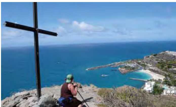
Utsikt fra "Korset". Her er det strålende utsikt, ikke minst til Anfi del Mar og stranda der.

For den som ikke vet det: Det er utrolig mange flotte turløyper ut fra den "norske" landsbyen Arguineguin. Du finner utmerkede turområder med startpunkt i Arguineguin, veldig lett tilgjengelig.