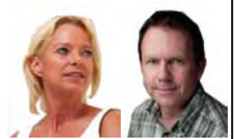
Nye skoleledere s. 22