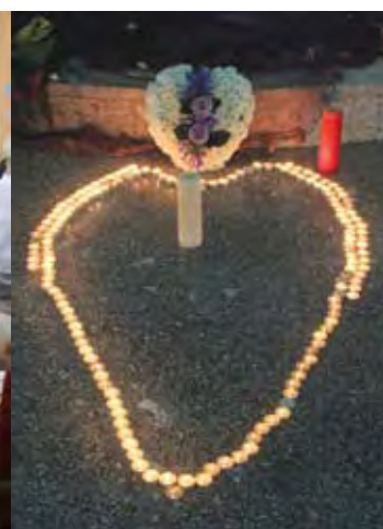
Kransen med 77 blomster er en gave fra Den Katolske kirken