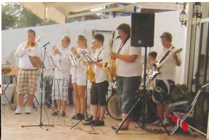
"Laspen´s Lille Storband", på kirketerrassen 31.juli

Vestad er også ivrig engasjert i musikalsk arbeid for utviklingshemmede. Han har arbeidet med