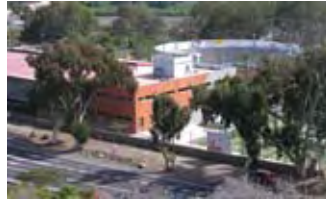
Idrett- og kulturhuset s.16