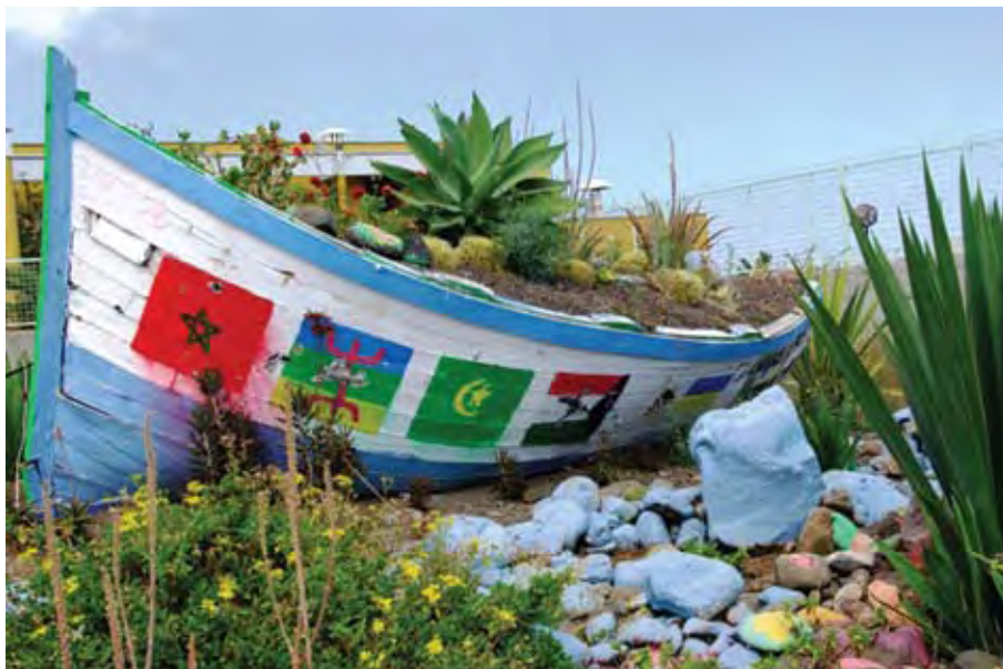
I denne cayucoen kom det 7 unge immigranter. Cayucoen står utenfor mottaket, som et sterkt symbol. I båten har guttene lagt ned en sten for hver av dem som var med, mens flaggene på båtripa viser landene guttene kommer fra.

De penger som ble reist i aksjonen i Mogan i 2007 ble kanalisert til et mottak i Arinaga, et senter spesielt nevnt i Human Rights Watch hvor det sies at forholdene har bedret seg vesentlig, bl.a. på grunn av at antall barn er gått ned.