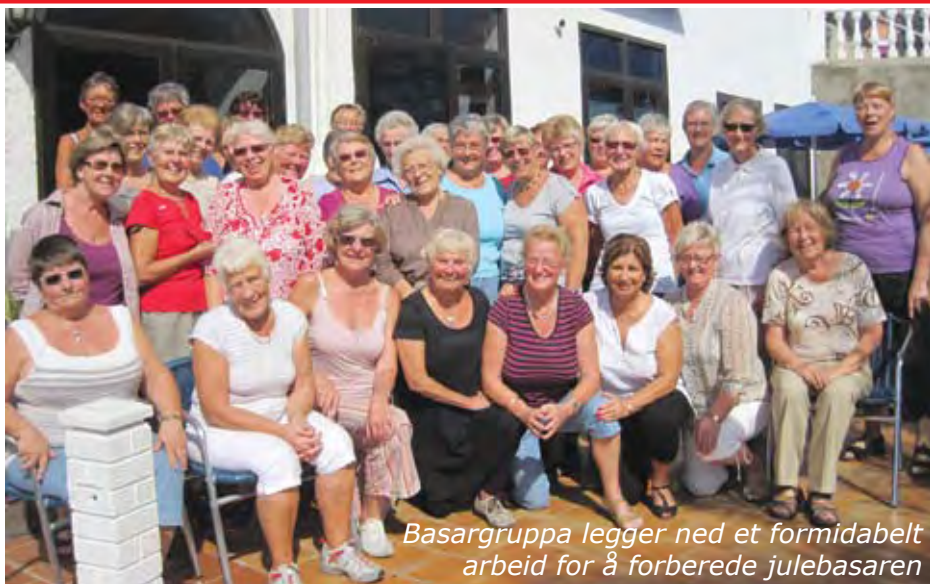
Basargruppa legger ned et formidabelt arbeid for å forberede julebasaren

begge dager. Vi er glad for de mange som legger ned et stort