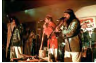
Altiplano- konsert s. 14