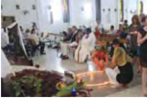
Minnemarkering s. 9