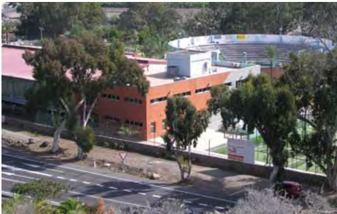
Idretts- og kulturparken ved innkjørselen til Arguineguin